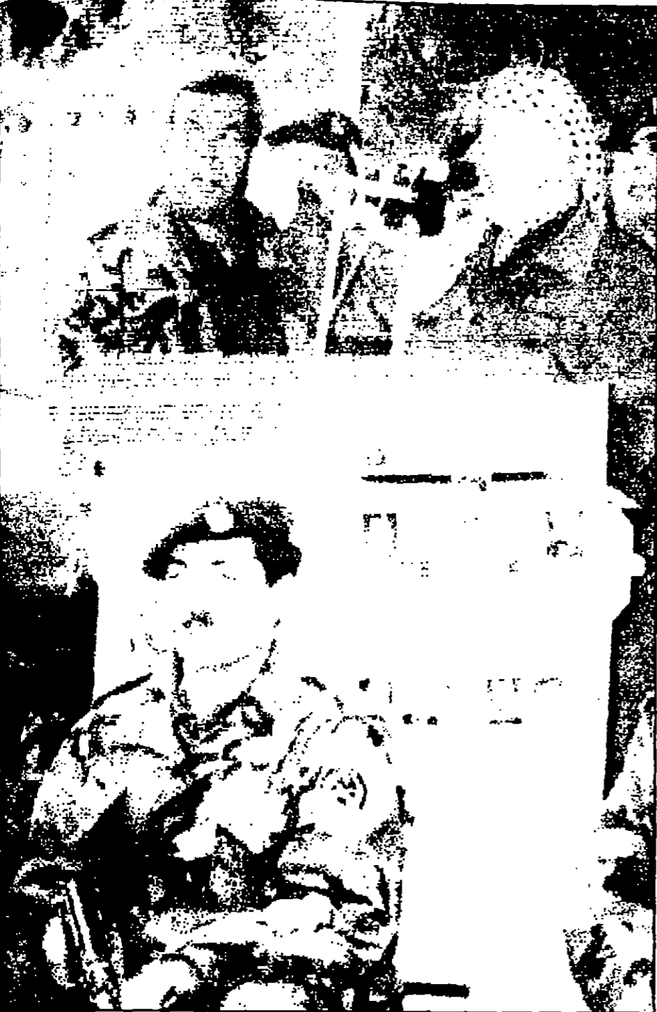
الرئيس عرفات خلال الاحتفالات بمناسبة الذكرى الحادية والثلاثين لانتفاضة حركة فتح في غزة